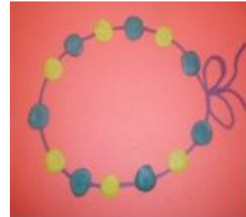
Лепка «Бусы для мамы»