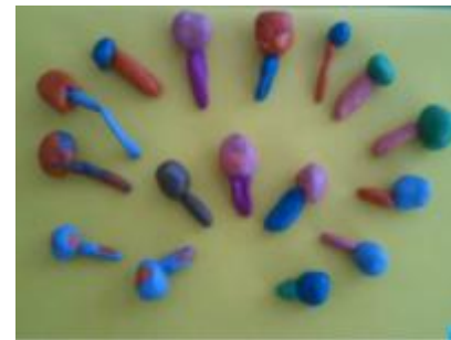
Лепка «Погремушка сестренки»