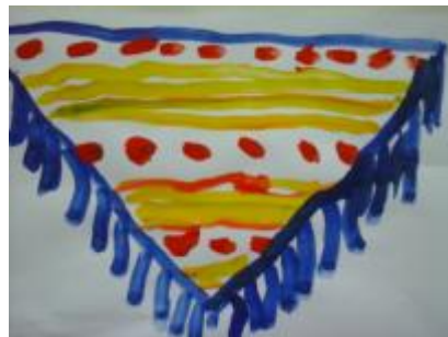
Рисование «Платочек для бабушки»