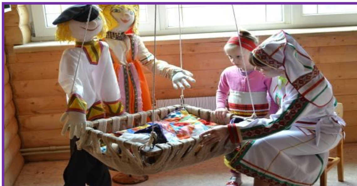
Фото 10. Исполнение колыбельных народных песен в музейном уголке «Займише»