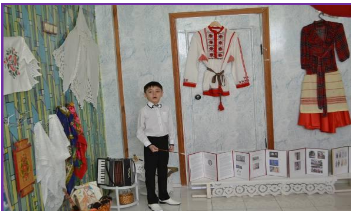
Фото 18. Экспозиция «Чувашский народ»

Материалы и оборудование: книга с чувашскими легендами, иллюстрации с убранством чувашской избы, кулечек с зерном, кувшин с молоком и вязанные шерстяные носки или нитки, баночка меда, посуда, украшенная резьбой, вышивка, детский ткацкий станок, народные музыкальные инструменты, диск с записью народной мелодии.