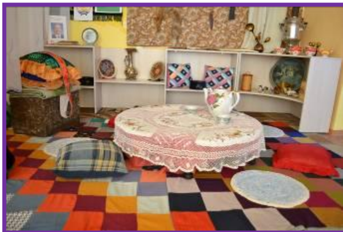
Фото 15. Женская часть башкирской юрты

Закончив петь, дети быстро бегут к своим стульям, берут платок за концы и натягивают его над головой в виде шатра. Получается юрта. Выигрывает та группа детей, которая быстрее всех сделала юрту.