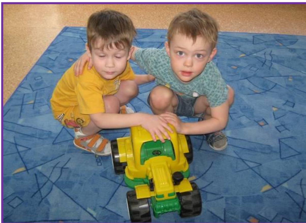
Фото 4. Совместная деятельность со сверстниками детей II младшей группы