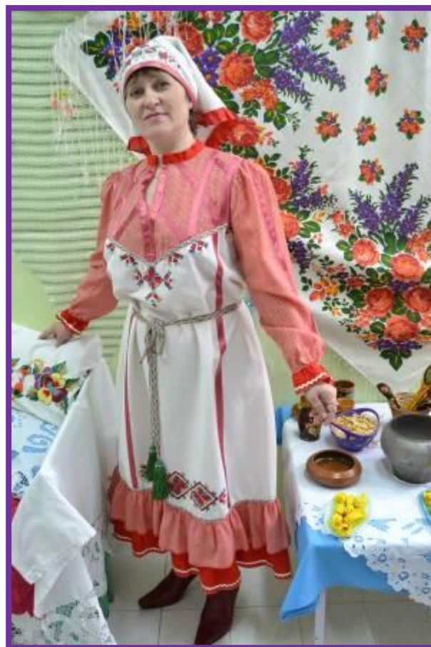
Фото 19. Приветствие участников педагогической вертушки

Воспитатель. Сегодня мы совершим путешествие в прошлое. Поговорим о нашей малой Родине, о Чувашии. Ну, что ж в путь (музыкальная заставка - чувашская мелодия).