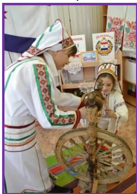
Фото 9. «Мордовские рукодельницы»

Национальный мордовский язык разделяется на два диалекта: мокшанский и эрзянский.