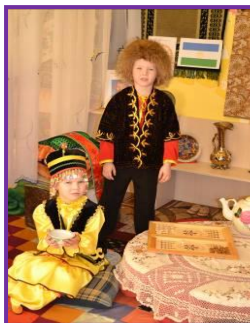
Фото 13. «Башкирское чаепитие»

Воспитатель. В те времена не было больших домов, машин, магазинов. (Воспитатель приглашает детей в юрту и предлагает посмотреть предметы, вещи в юрте). Люди ничего не могли себе купить из одежды