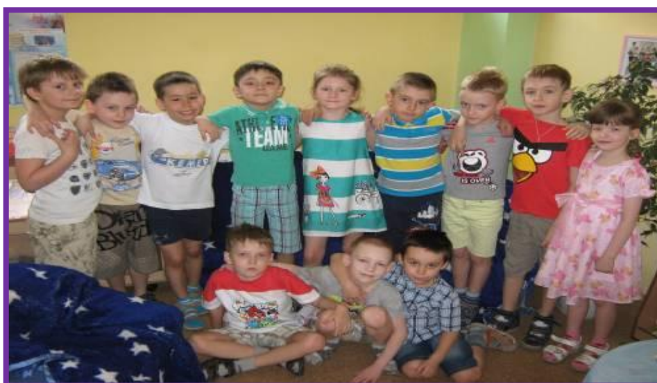
Фото 6. «Наша дружная многонациональная группа»