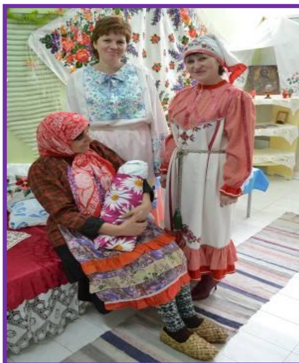
Фото 21. Ознакомление с особенностями национального костюма чувашского народа

Воспитатель. Переходим к выставке «Национальный костюм». (На фоне музыки).