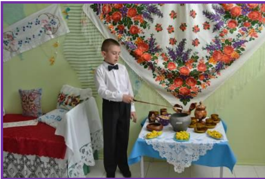
Фото 20. Представление предметов быта чувашского народа

На полу настилали полу брёвна. Крышу крыли соломой. Солому накладывали толстым слоем, чтобы было тепло.