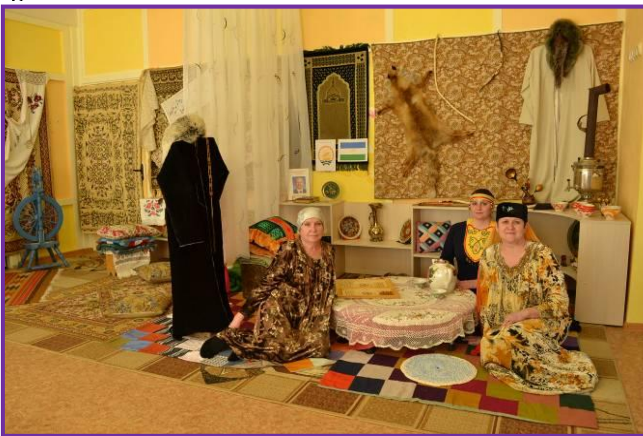
Фото 17. Участники организации и проведения маршрута педагогической вертушки «Башкирская юрта» – воспитатели МБУ д/с №116

Воспитатель. А сейчас я приглашаю вас выпить чаю с башкирским медом и с баурсаками и послушать мелодию, исполняемую на народном башкирском музыкальном инструменте - курай.