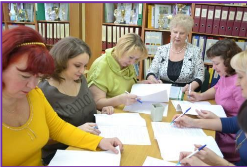
Фото 1. Заседание творческой группы

Программа «Воспитание толерантного дошкольника» направлена на формирование основ толерантности у детей от 3 до 7 лет.