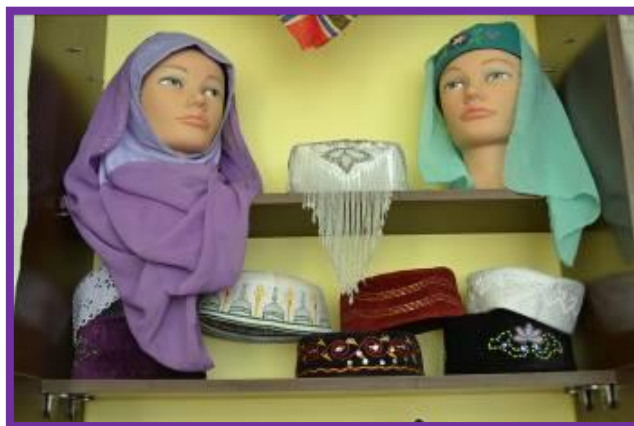
Фото 29. Выставка головных уборов татарского народа

Головным убором мужчин, была четырёхклинная, полусферической формы тубетейка (тубэтэй) или в виде усечённого конуса (кэлэпуш). Праздничная бархатная тубетейка вышивалась яркой вышивкой.