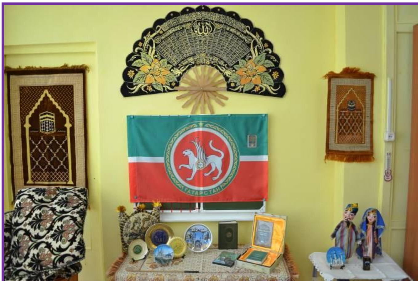
Фото 26. Символика и национальные сувениры Татарстана

Материалы и оборудование: музейная экспозиция «Татарский дом», предметы быта, национальной посуды, костюмов, изделий и украшений, элементов декора, книги, альбомы с фотографиями, иллюстрации, аудиозаписи.