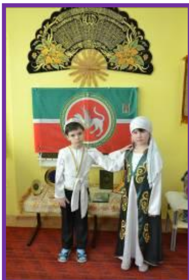
Фото 28. Ознакомление воспитанников с особенностями государственного герба Татарстана

Воспитатель. Еще одна неотъемлемая часть символики Татарстана – его государственный герб. На гербе изображен крылатый барс, с закрепленным на боку круглым щитом, его лапа приподнята, он стоит на фоне солнца, обрамленный национальным татарским орнаментом с надписью «Татарстан». Крылья барса состоят из семи перьев, а розетка на щите насчитывает восемь лепестков цветка астры. Сам герб имеет круглую форму, он выполнен в таких же цветах, как и флаг. Солнце на гербе – красное, обрамление – зеленое, барс и его крылья и розетка на щите – белые.