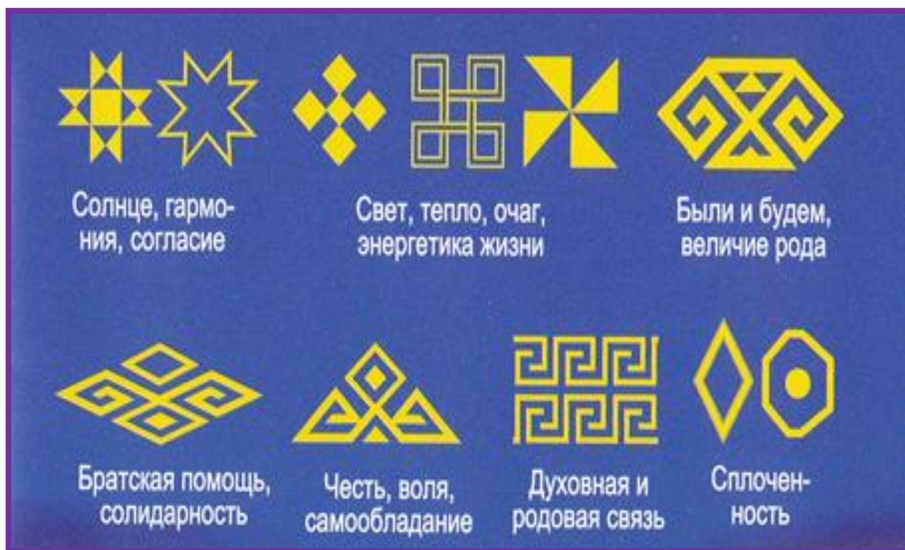
Рисунок 2. Элементы чувашского орнамента

Богатое наследие оставили нам предки. Ярким представителем декоративно-прикладного искусства является народный костюм, в котором отражаются разнообразная вышивка и элементы ткачества. Работа эта требовала много времени и сил. Сначала нужно было