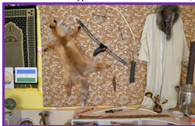
Фото 16. Мужская половина башкирской юрты

Все предметы быта башкир – сундуки, подставки, колыбели, посудные полки выполнены из дерева.