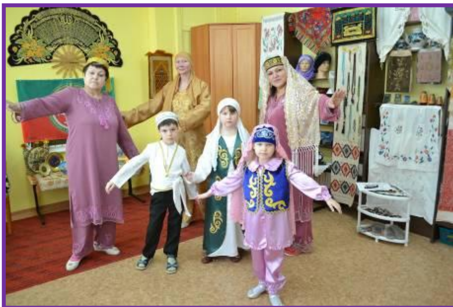
Фото 31. Исполнение татарского народного танца педагогами и воспитанниками подготовительной группы

подошвой, нередко сшитые из цветной кожи. Рабочей обувью на селе были лапти.