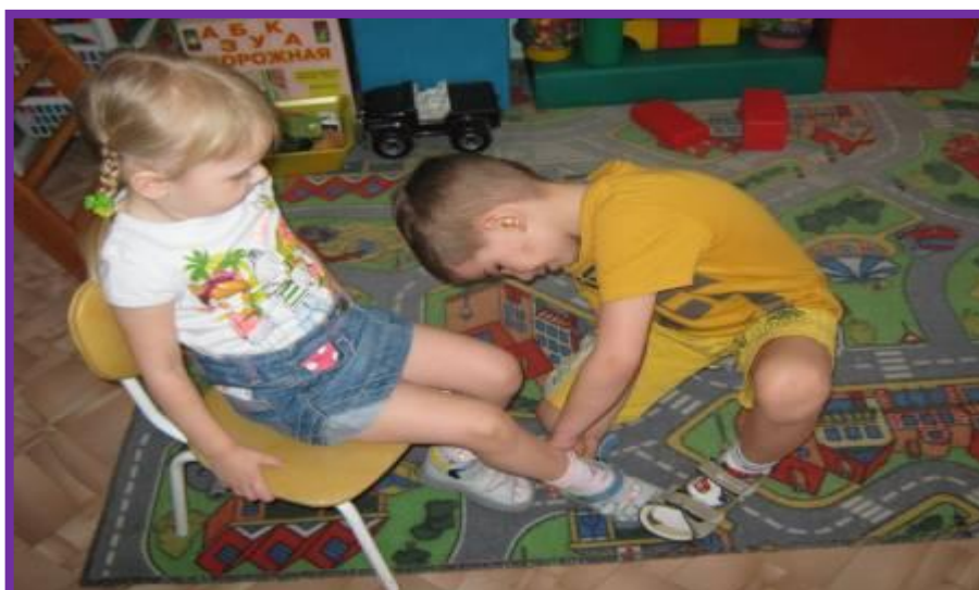
Фото 5. Моделирование проблемной ситуации «Чем бы ты помог?»