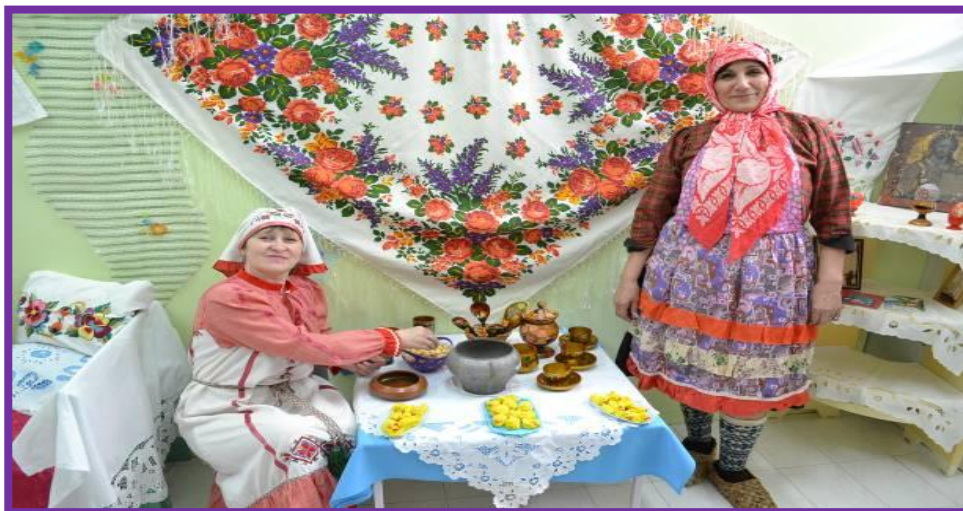
Фото 25. Дегустация народных чувашских блюд

А ещё я хочу добавить, что чувашский народ очень гостеприимный и что бы вы в этом убедились, мы вас приглашаем на дегустацию чувашских блюд и напитков. (Под музыку проводится дегустация).