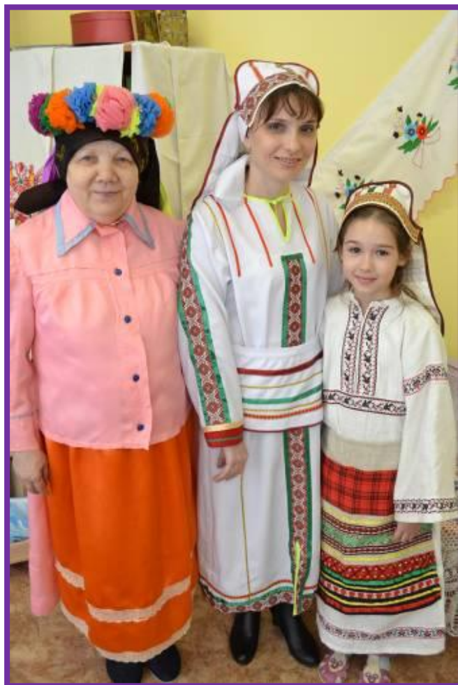
Фото 10. Мордовские народные костюмы