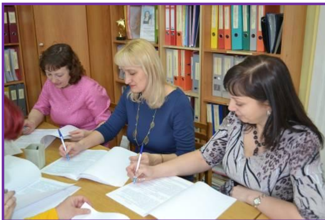
Фото 2. Разработка программы творческой группой