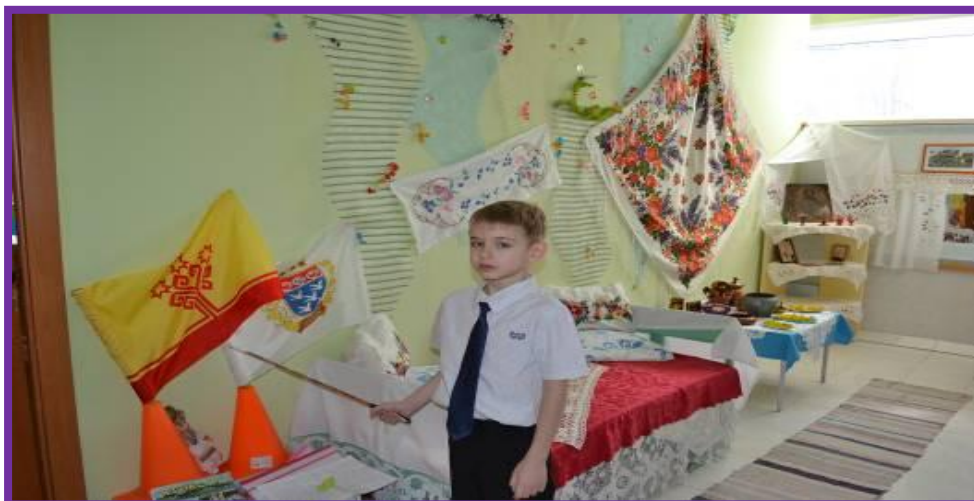
Фото 24. Символика Чувашской Республики

Воспитатель. Вот спасибо, сколько пословиц вспомнили.