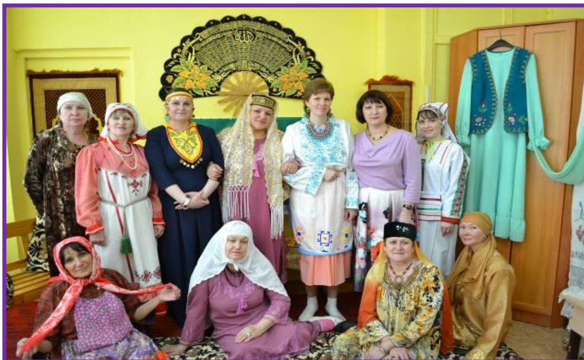
Фото 33. Наш дружный многонациональный коллектив

Мы знаем, что каждая народность имеет свою столицу, свои флаги, гербы, гимны, свой язык. Но все народы объединены дружелюбием, добротой, трудолюбием, сплоченностью. Каждый народ сохраняет свои высокие духовные ценности и культурные традиции, передавая их из поколения в поколение.