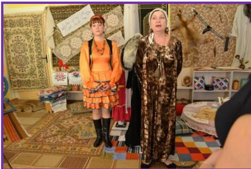
Фото 12. Экскурсия в музейный уголок «Башкирская юрта»

Старинное жилище кочевых народов Башкирии называется юрта, или «тирме». (Дети повторяют «юрта» и «тирме»)