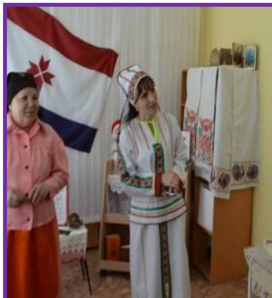
Фото 8. Проведение педагогической вертушки педагогами подготовительной группы

Мокшанский и эрзянский языки являются литературными языками, на них издаются книги, газеты.