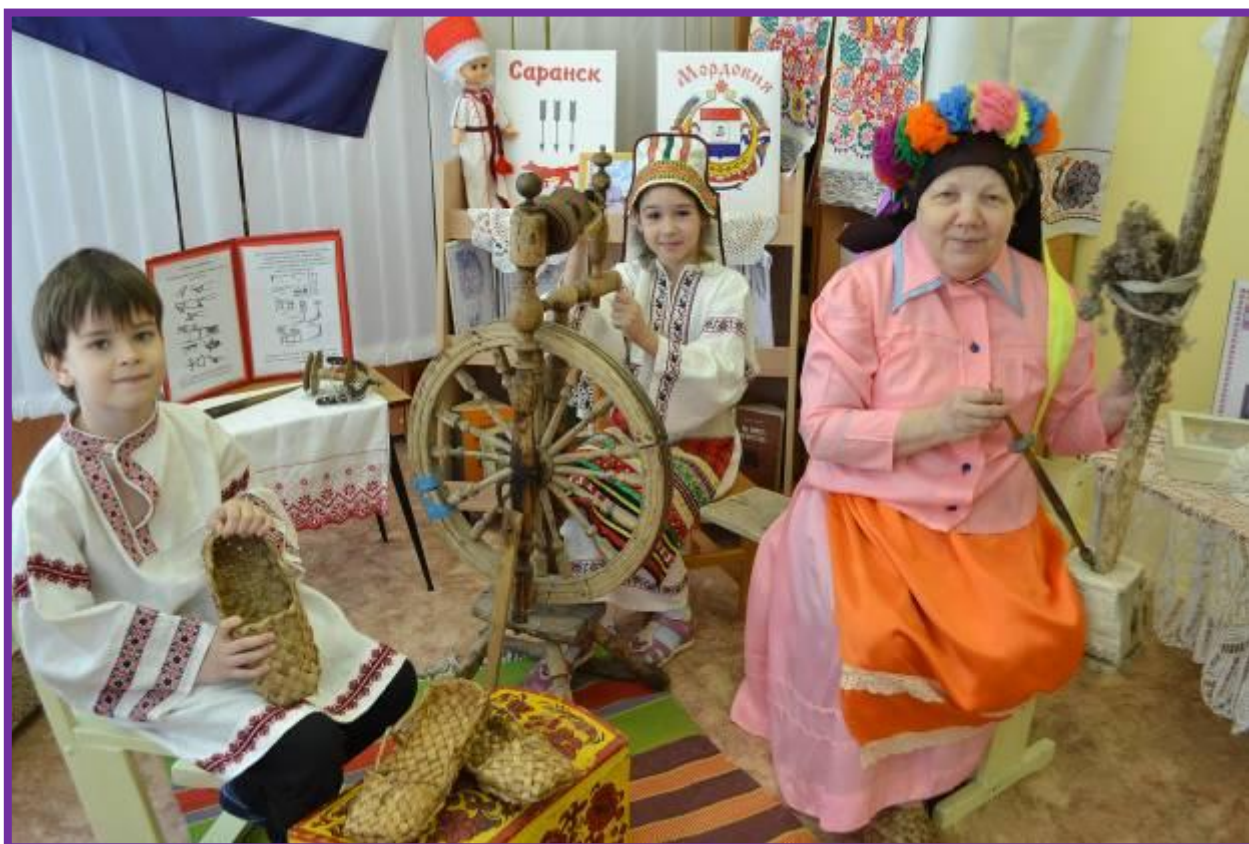
Фото 7. Экспозиция: «Мордовский народ»

Материалы и оборудование: "Мордовская изба", сундук, веретено, палочка-лучина, лапти, "печь", чугуны, деревянные ложки, пироги, солёное тесто.