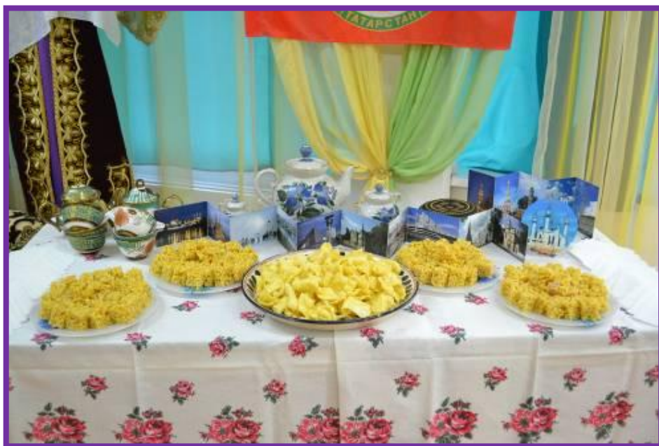
Фото 32. Дегустация татарских народных блюд

Воспитатель. Издавна татары занимались оседлым земледелием и животноводством, что способствовало преобладанию в пище мучных и мясомолочных блюд. Любимым мясом у татар всегда считалась баранина. В татарской кухне много молочных блюд. Самое большое разнообразие в татарской кухне по сей