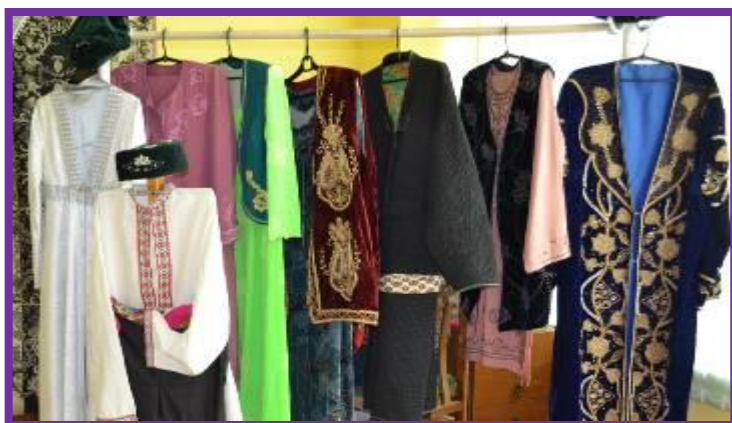
Фото 30. Выставка женской и мужской одежды татарского народа

Девушки носили мягкие белые калфаки, тканые или вязаные. Замужние женщины поверх них, выходя из дома, набрасывали легкие покрывала, шелковые шали, платки. Носили также налобные и височные украшения – полоски ткани с нашитыми бляхами, бусинами, подвесками.