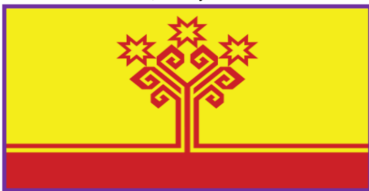
Рисунок 4. Флаг Чувашской Республики

Ребёнок. Когда-то давным-давно в мире было три солнца и находились они близко к земле. Люди не знали, что такое зима, снег, лед. Вокруг росли удивительные растения, которые давали людям все то, что нужно было для жизни. Но были люди, которые не понимали это.