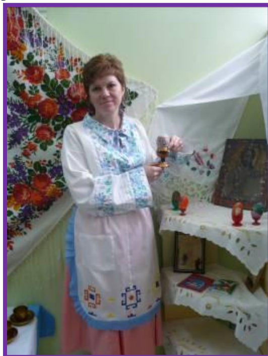
Фото 22. Чувашские праздники

Ребёнок. Я знаю о празднике саварни. Это весёлый праздник проводов зимы и встречи весны, очень похожий на русскую масленицу. Во время саварни в деревнях молодёжь устраивала катание на лошадях, обвешенных колокольчиками и бубенчиками, украшенных платками и полотенцами. Детвора каталась с гор на салазках. Взрослые и старики устраивали традиционные обрядовые пиршества с блинами (икерче) и колобками (иава). Все одаривали друг друга подарками, орехами, семечками. Ровно в полночь торжественно зажигали чучело «масляничной бабы». Вокруг жарко горящего костра собиралась вся деревня.