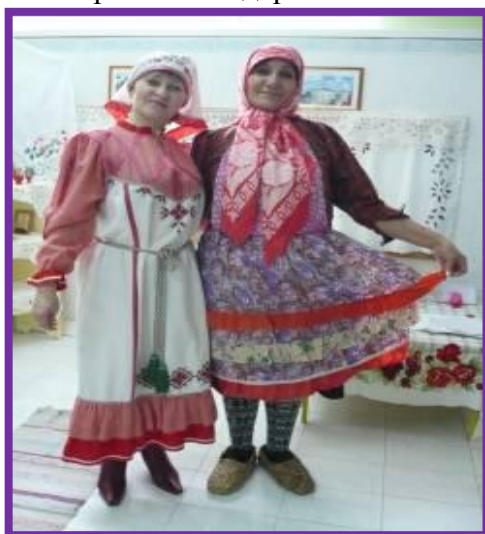
Фото 23. Чувашская народная игра «Тухьян тахан»

Ребёнок. День наступления пасхи назывался Манкун. В этот день по представлениям чувашей солнце восходит, пританцовывая, то есть особенно торжественно и радостно. К великому дню на центральной площади или на солнечном пригорке взрослые устраивали для детей качели. Весь день около них играла детвора. Играли в разные игры: в чижика, лапту, непременно играли в яйца. Воспитатель. А давайте и мы с вами поиграем в чувашскую народную игру «Тухьян тахан» (Надеть тухью!)