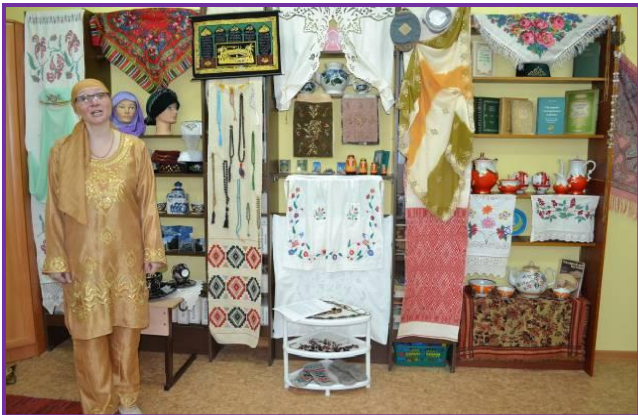
Фото 27. Ознакомление с предметами быта татарского народа