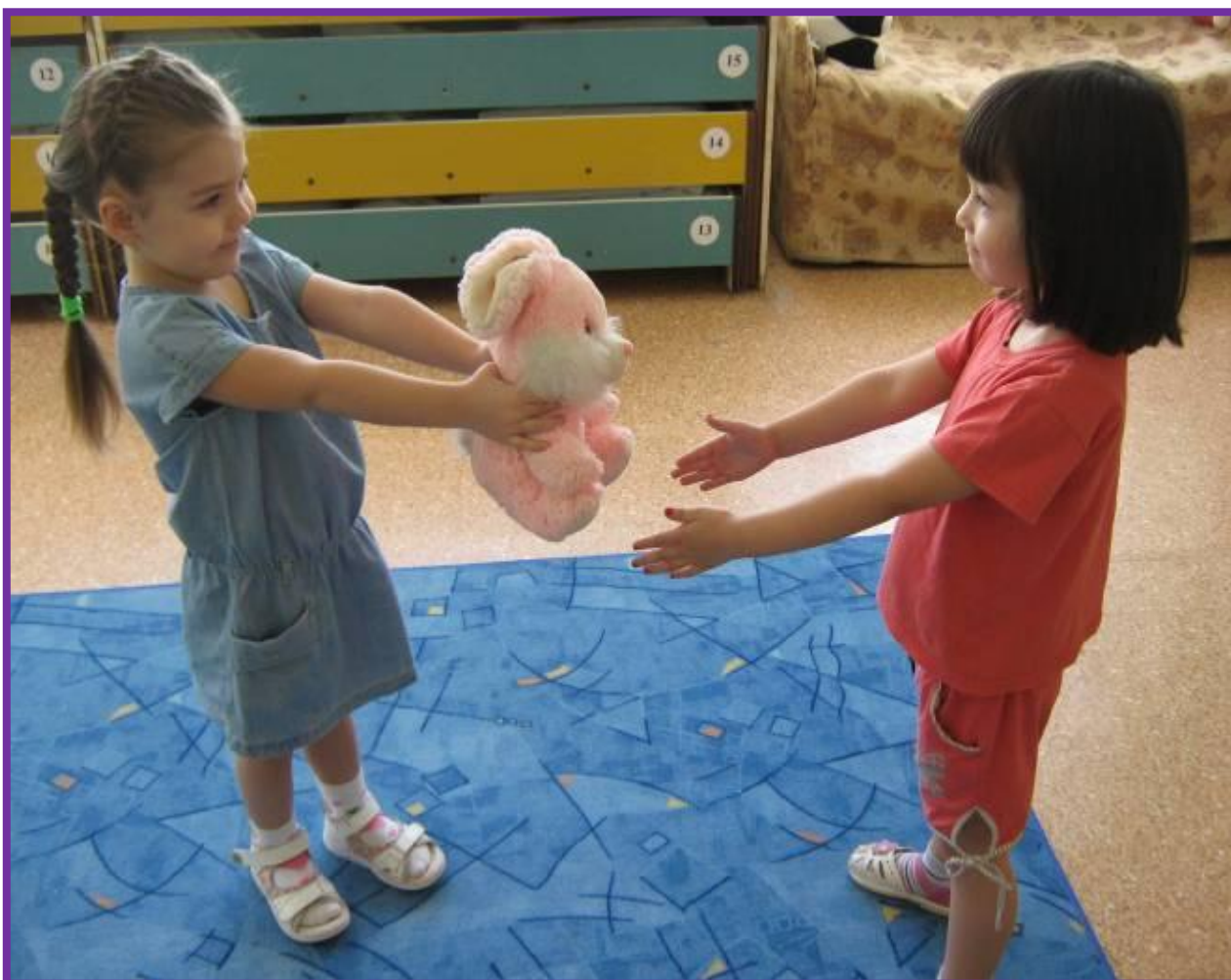
Фото 3. Игровая деятельность детей II младшей группы

6.Развитие чувства близости, доверия безопасности по отношению к другим людям.