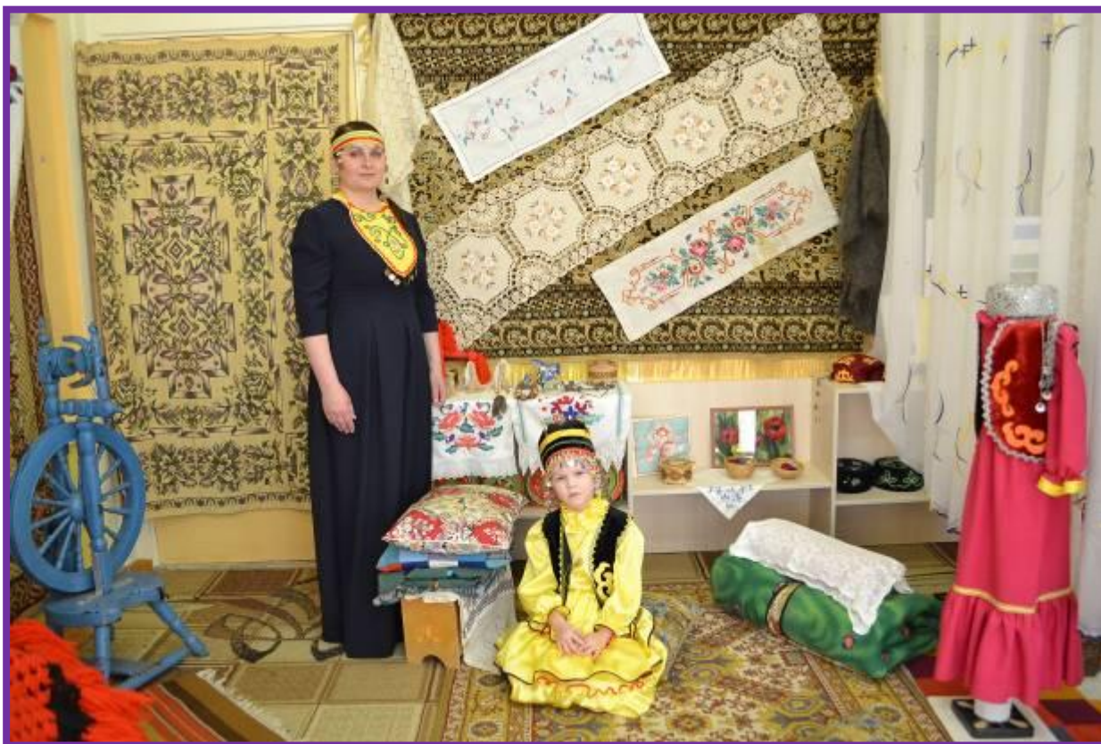
Фото 14. Декор внутреннего убранства башкирской юрты

Воспитатель. За животными нужно ухаживать, кормить их свежей и сочной травой, поить чистой водой. Чтобы найти луга и поля с такой травой, башкирам всей семьей приходилось переезжать с места на место, поэтому башкирский народ вел кочевой образ жизни. Чтобы постоянно не строить новые дома на новом месте, у людей были легкие, прочные, переносные и очень удобные дома. Эти дома назывались – тирмэ, что в переводе с башкирского языка означает юрта.