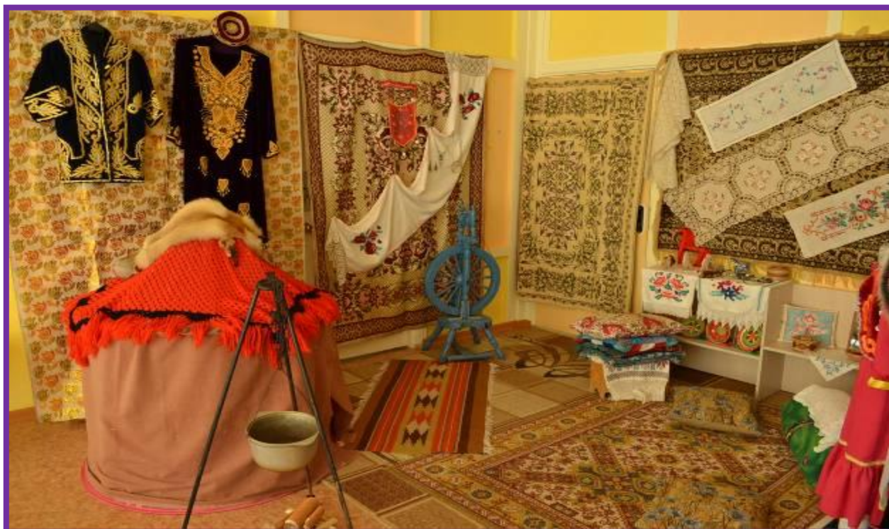
Фото 11. Экспозиция «Башкирская юрта»

Материалы и оборудование: музейная экспозиция «Башкирская юрта» (предметы быта башкир); альбом с фотографиями, иллюстрации, аудио-записи, видео, интернет-ресурсы.